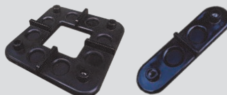
Vierfach- und Zweifachverbinder